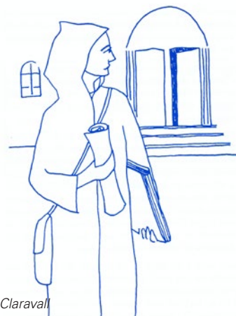
Bernat de Claravall