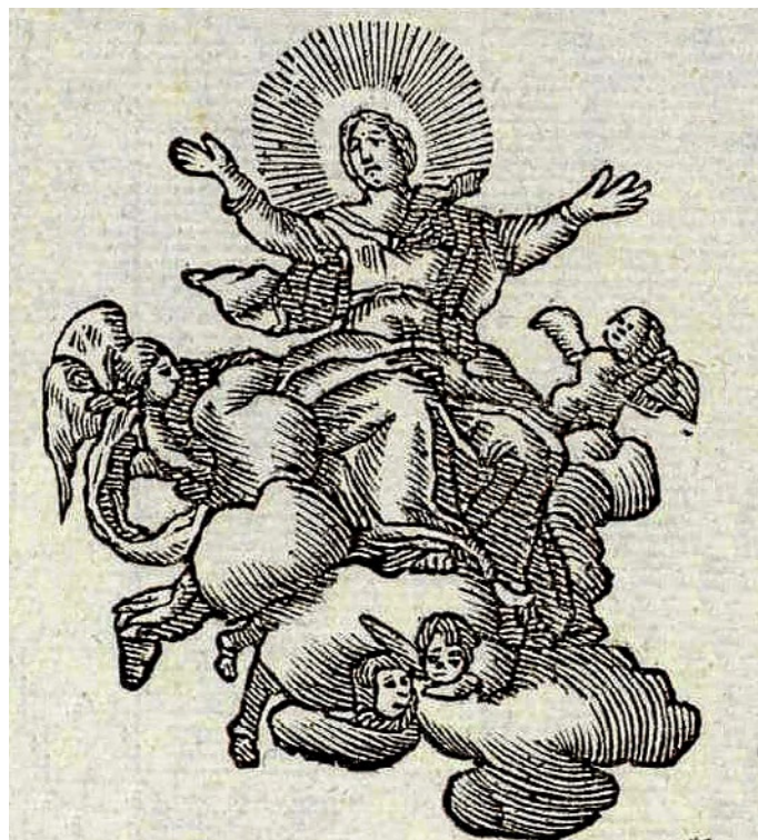
Imatge d'uns goigs antics de l'Església de Santa Maria de Vilabertran.

En mans de l'Esperit des de la concepció